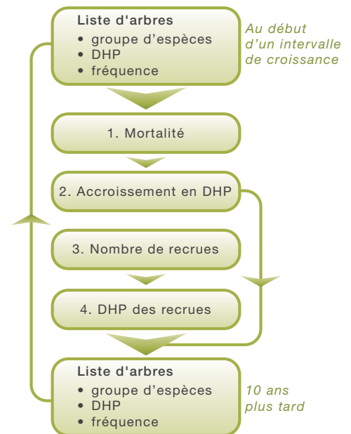
Figure 1. Fonctionnement d'ARTÉMIS-2009 (DHP : diamètre à hauteur de poitrine)

Un modèle de croissance forestière est un ensemble d'équations mathématiques représentant les changements temporels des caractéristiques dendrométriques d'un peuplement et des dimensions des arbres qui le forment. Il permet de prédire les volumes disponibles à la récolte forestière, par espèce ou groupe d'espèces. En plus de la croissance des arbres, ces modèles tiennent généralement compte de la mortalité induite par la compétition et du recrutement de nouveaux arbres.