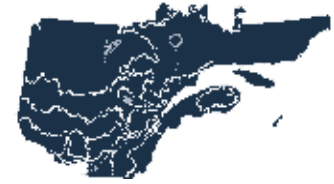
Territoires où les résultats s'appliquent.

NATURA-2009 est un modèle de croissance forestière par peuplement entier. Il comprend cinq sous-modèles (Figure 2) utilisant des variables biophysiques et cinq groupes d'espèces qui permettent de modéliser les peuplements mixtes. L'utilisation des sous-domaines bioclimatiques fournit des prévisions régionales. Ce modèle estime l'effet des défoliations causées par la tordeuse des bourgeons de l'épinette et tient compte de l'occurrence de perturbations naturelles légères. Les périodes de croissance et de sénescence d'un peuplement sont modélisées simultanément. La mortalité et le recrutement des arbres sont modélisés par le biais du changement temporel du nombre de tiges, sans distinction entre les deux phénomènes. Une estimation de l'incertitude associée aux prévisions peut être calculée.